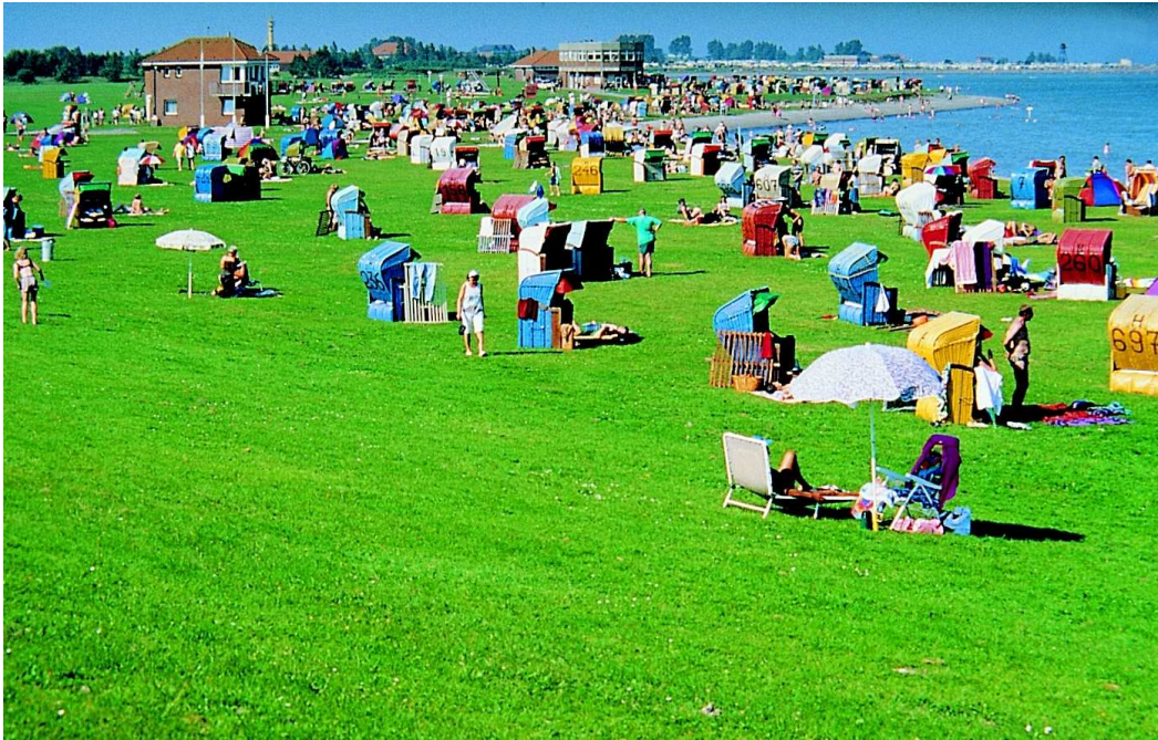
Erstellt am: 27.01.2020